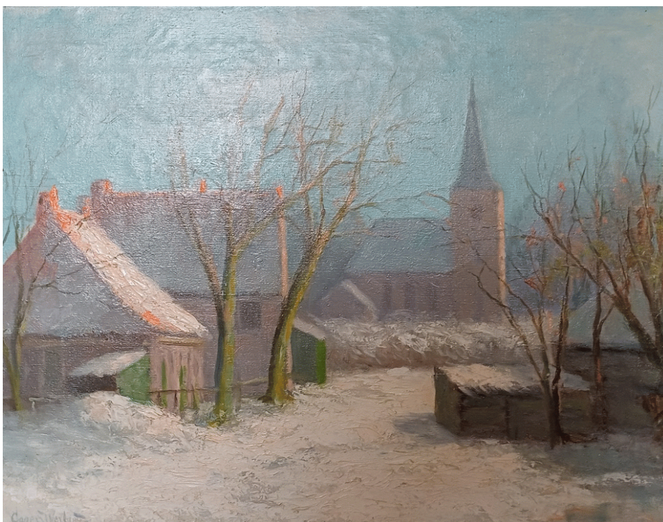
Schilderij Casper J. Verlint